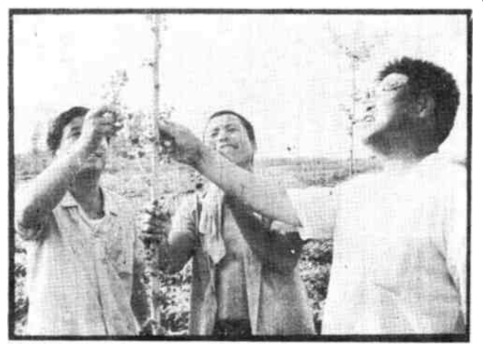
东营区龙居乡积极探索经济林发展新路子。今年，该乡在区林业局指导下试植了50亩银杏树全部成活，长势良好，从而为大面积推广积累了经验。

李军章 据报载，某企业与外商经多次洽谈达成合资企业协议，不料在合资企业筹建中，外商却以设备涨价为由，多次要求追加投资。该企业合资建厂心切，在不做任何市场调查的情况下满足了对方的要求。结果合资厂虽建成了，但含金量却很低，而外商的投资额则大都是设备加价的部分。 另有一家企业在遇到上述情况时，却采取了完全相反的策略，既通过市场调查，也通过有关国际业务代理部分查询，经过巧妙的谈判，终使外商在大量事实面前让步。双方以诚意把合资厂办成了。 同样一件事，为何会出现两种结果呢？笔者认为主要是对外商的认识和态度造成的。前者看不到外商是商人也是商人，是合作者也是竞争者这一本质问题。而后者善于按市场经济的特定规律审时度势，不偏信、不盲从，从而维护了自己的利益。 吸引外资，是加快我国现代化进程的有效手段。但切需注意的是，外商也是商人，与外商合作必须以经济利益为基础。复杂多变、险象环生，是市场经济所具有的特征，任何人都不可有侥幸心理。要想成为一名在市场经济海洋里弄潮冲浪、出奇制胜的行家里手，必须具有立体思维，以多维的商品经济意识从云诡谲的商战中识辨真伪。